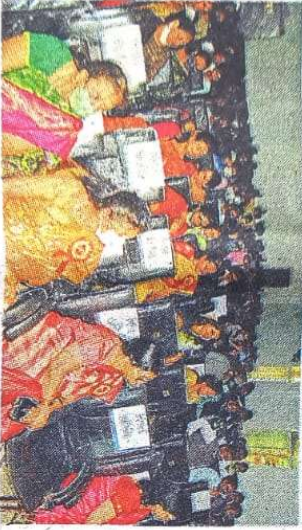
स्मृति चिन्ह देते कॉलेज प्राचार्य एवं उपस्थित अतिथि और कॉलेज स्टाफ।